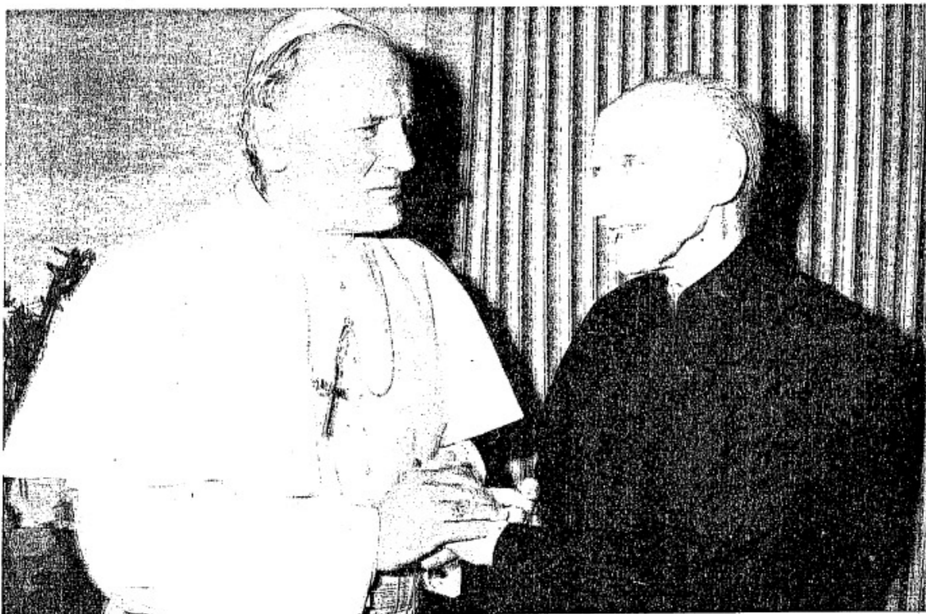
El padre Pedro Arrupe, junto a Juan Pablo II meses antes de la muerte del general de los jesuitas