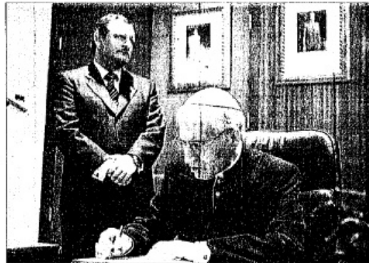
FIRMA. Rouco firmando en el libro de honor con el alcalde al fondo.

agradeció, por otra parte, la reivindicación de la figura del cardenal que realizó Rouco Varela en la homilía aunque aseguró que la intervención del cardenal arzobispo tenía «muchas lecturas».